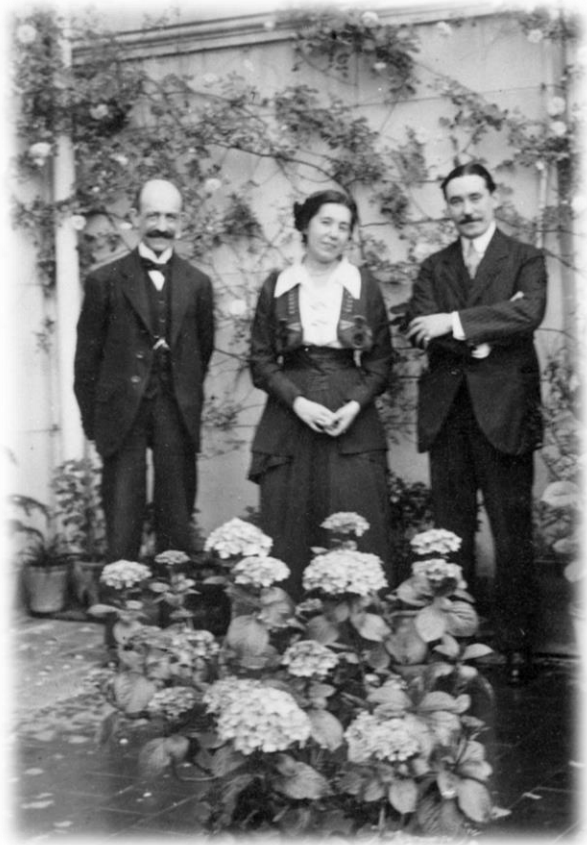
Manuel de Falla, María Lejárraga, Gregorio Martínez Sierra, Madrid 1916